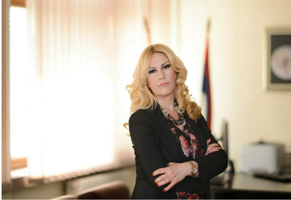
Председник суда, судија Тамара Радовић